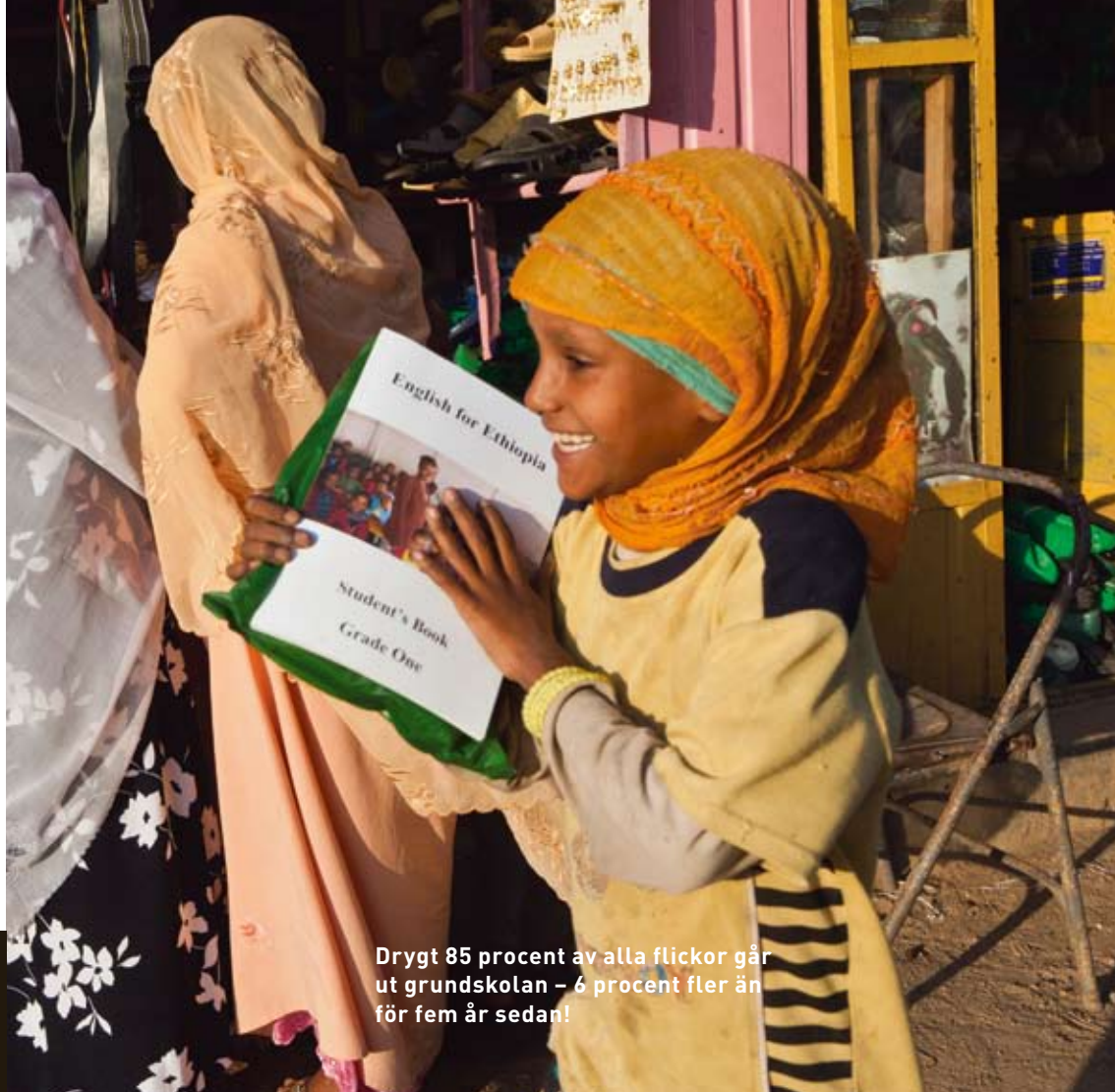
Drygt 85 procent av alla flickor går ut grundskolan – 6 procent fler än för fem år sedan!