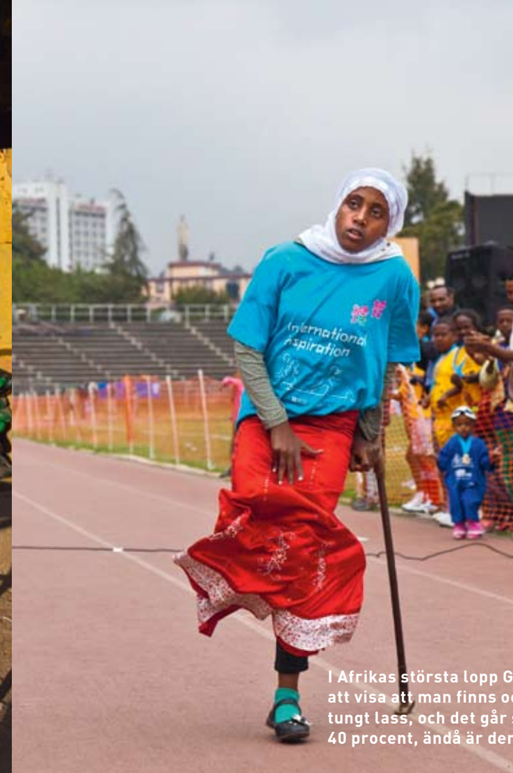
I Afrikas största lopp Great Ethiopian Run kan alla vara med på sina villkor. Att delta är att visa att man finns och är lika mycket värd som andra. Kvinnor kämpar på och bär ett tungt lass, och det går sakta framåt. 1990–2010 minskade mödradödligheten med 40 procent, ändå är den fortfarande hög; 676 av 100 000 kvinnor dör vid förlossning.