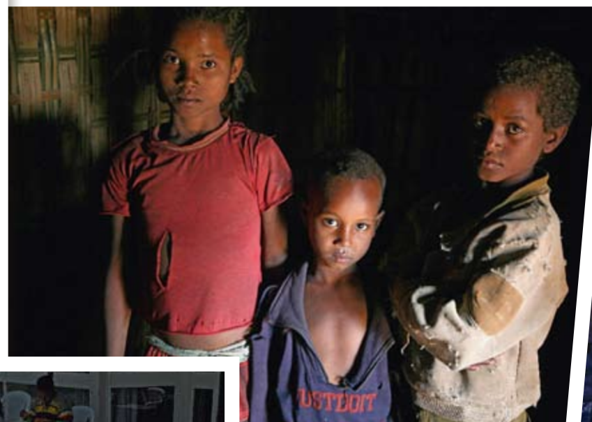
De här barnen går inte i skolan. De kommer att växa upp illitterata, de jobbar på familjens kaffeodling. De har nio syskon till. Men de svälter inte.