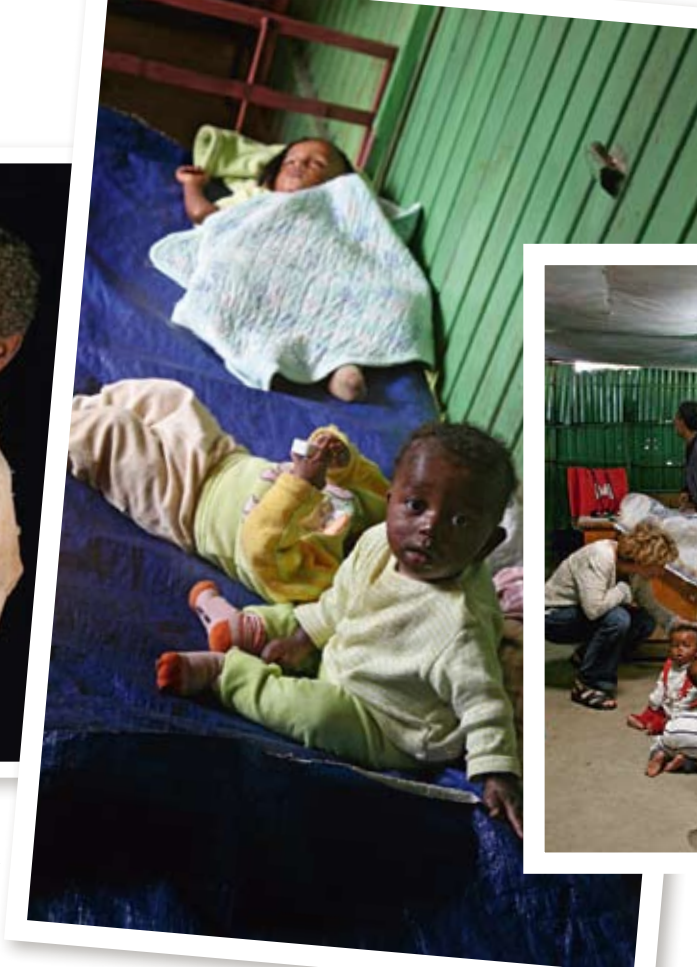
De här små liven har det bra just nu. Men sen... De är bebisar till mammor som blivit bortförda, våldtagna eller prostituerade. Här får kvinnorna lära sig sy eller bli damfrisörer så de ska klara sig bort från gatan.