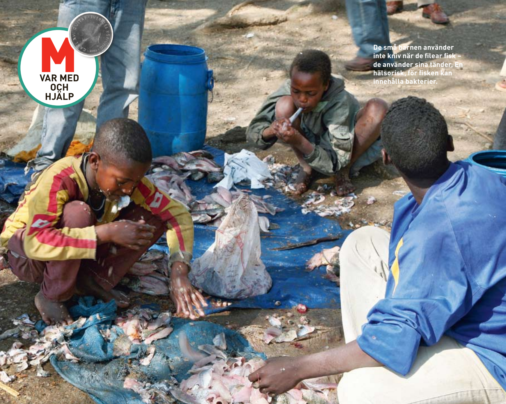
De små barnen använder inte kniv när de filear fisk – de använder sina tänder. En hälsorisk, för fisken kan innehålla bakterier.