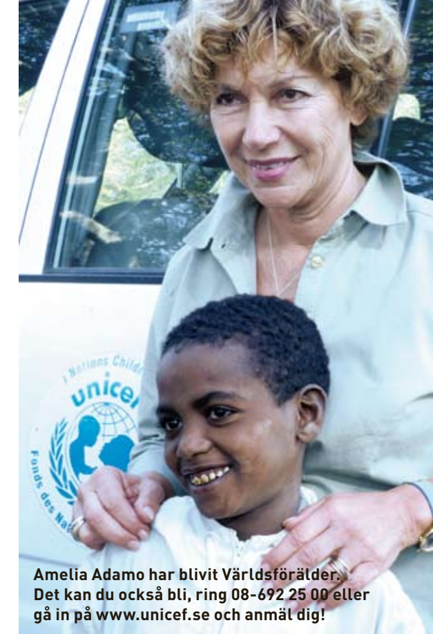
Amelia Adamo har blivit Världsförälder. Det kan du också bli, ring 08-692 25 00 eller gå in på www.unicef.se och anmät dig!