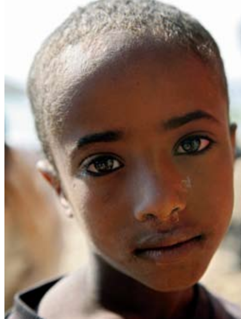
Botales, Shukurs och Kefeades liv kan du se när Unicef-galan visas i tv4 den 1 maj.