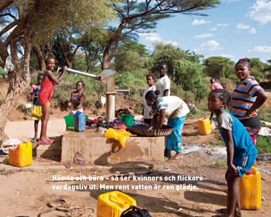
Hämta och bära – så ser kvinnors och flickors vardagsliv ut. Men rent vatten är ren glädje.