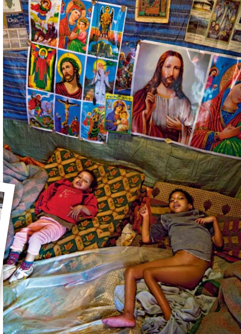
De förflamade barnen som både Gud och världen glömde. Deras pappa hoppas att det heliga vattnet ska hjälpa.