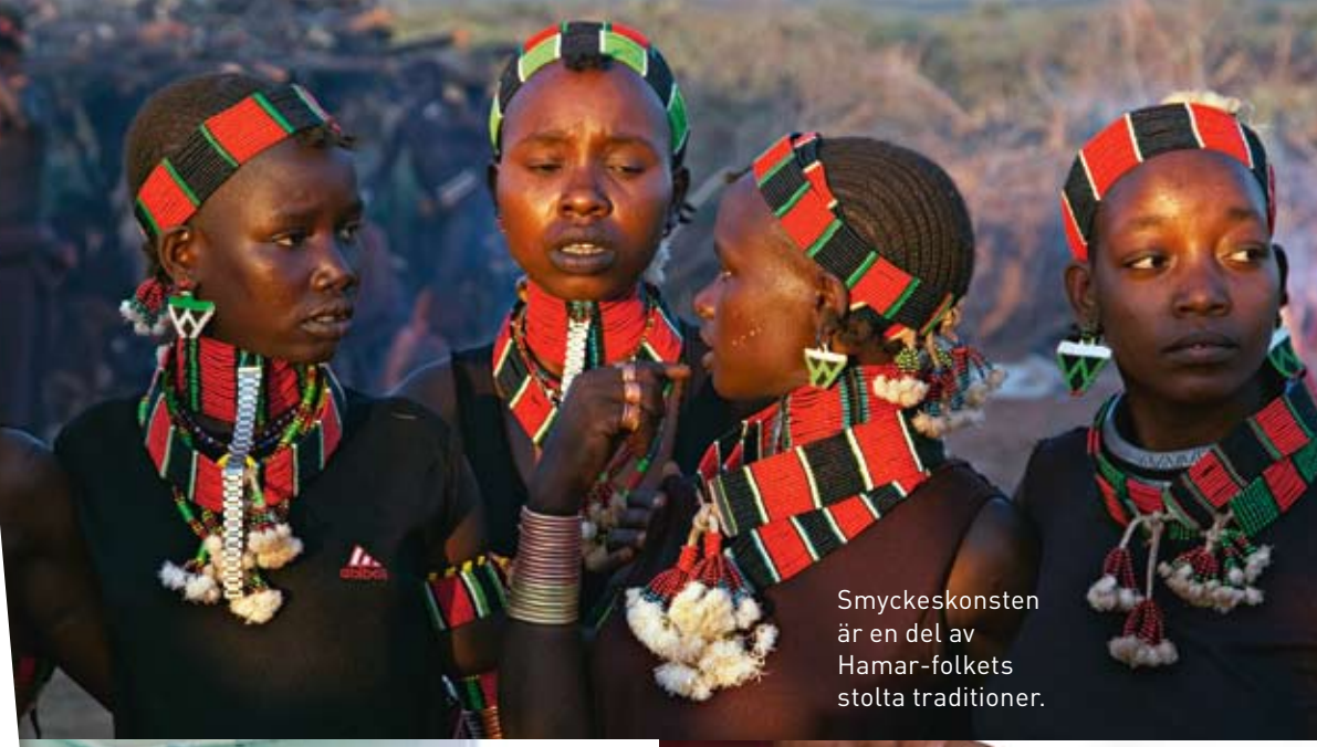
Smyckeskonsten är en del av Hamar-folkets stolta traditioner.