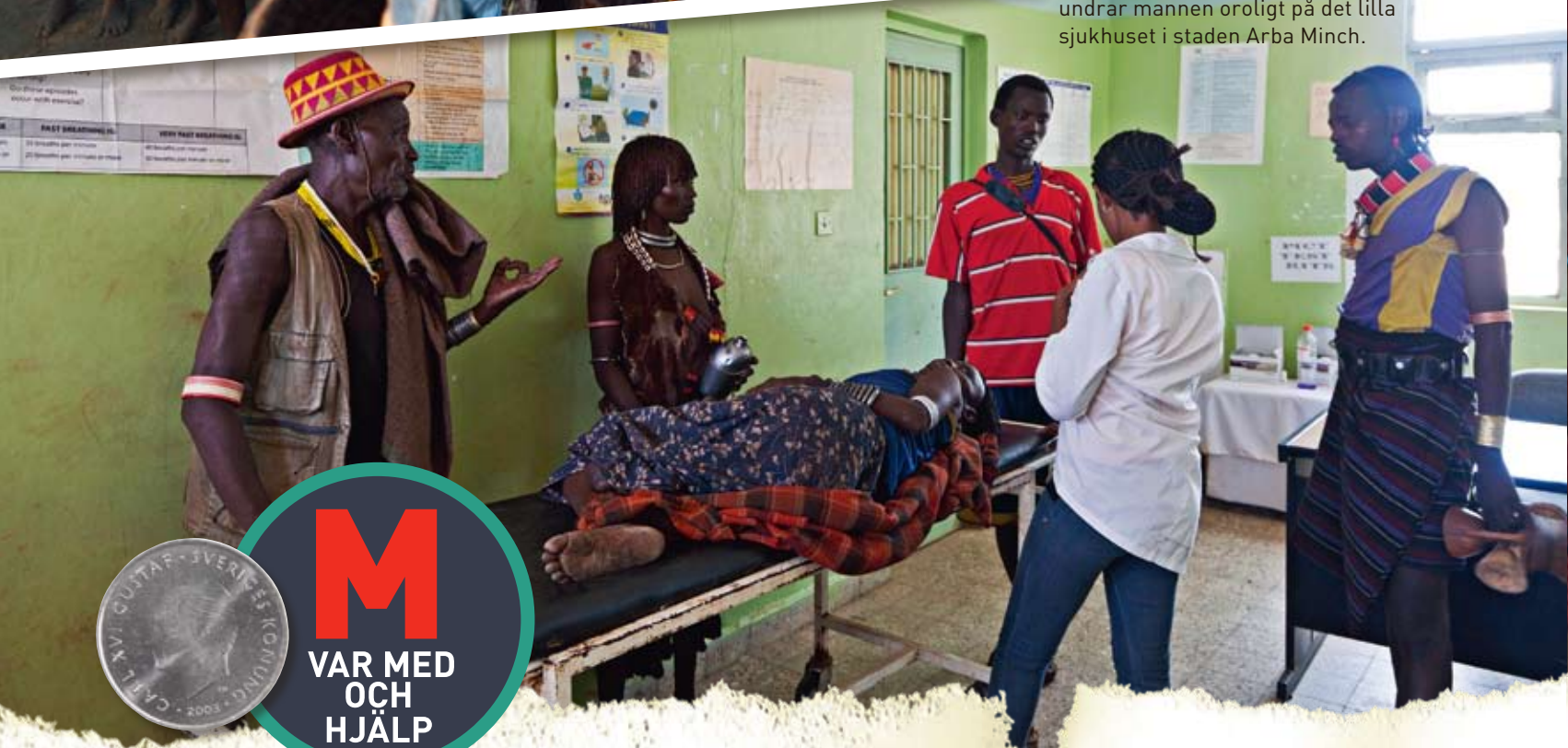
"Kan ni göra något för min fru?" undrar mannen oroligt på det lilla sjukhuset i staden Arba Minch.