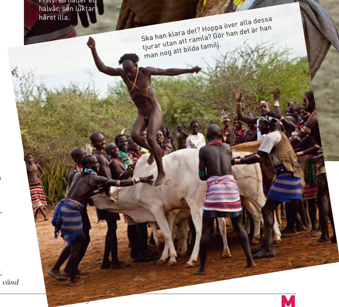
Ska han klara det? Hoppla över alla dessa tjurar utan att ramla? Gör han det är han man nog att bilda familj.