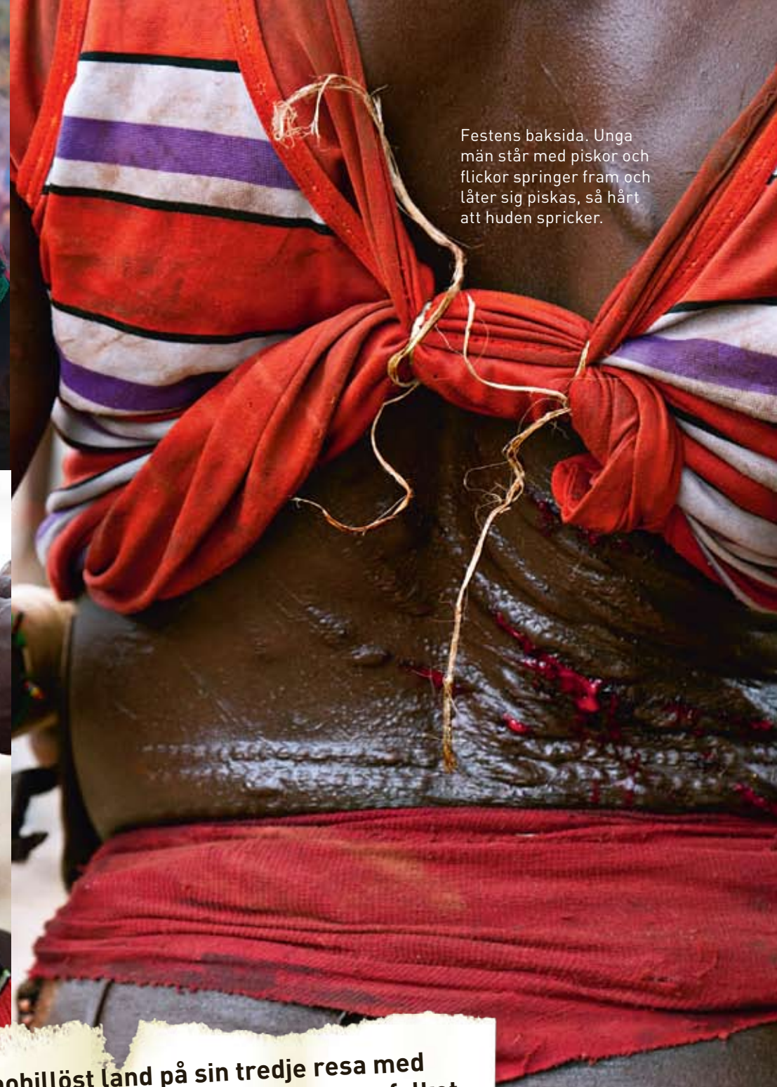
Festens baksida. Unga män står med piskor och flickor springer fram och låter sig piskas, så hårt att huden spricker.