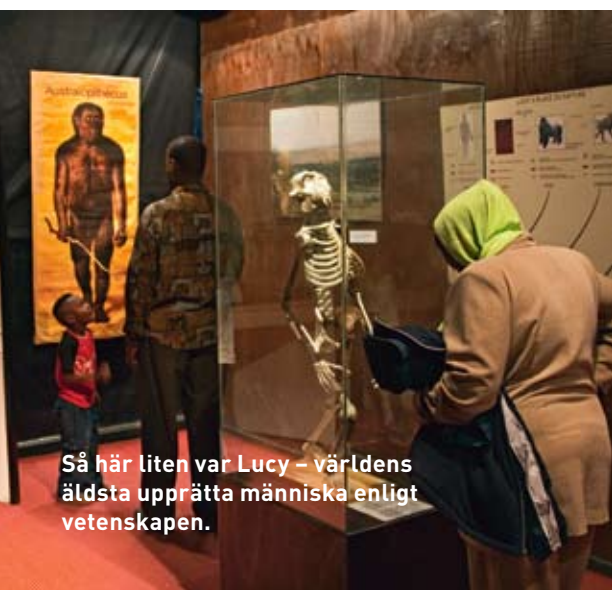
Så här liten var Lucy – världens äldsta uppräta människa enligt vetenskapen.

Eller en Indiana Jones-resa! De flesta har sett Jakten på den försvunna skatten när Harrison Ford spelar arkeologen som ska hitta Förbundsarken före Adolf Hitler. Du kan resa i hans spår. Eller i något annat spår. Vi guidar dig! ●