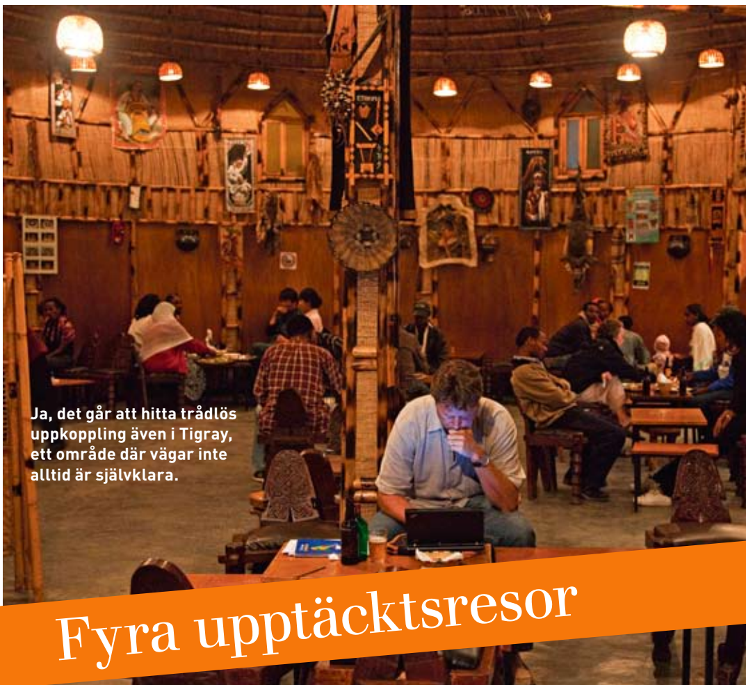
Ja, det går att hitta trådlös uppkoppling även i Tigray, ett område där vägar inte alltid är självklara.